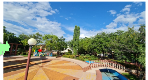
4 Alcaldia de Marcovia