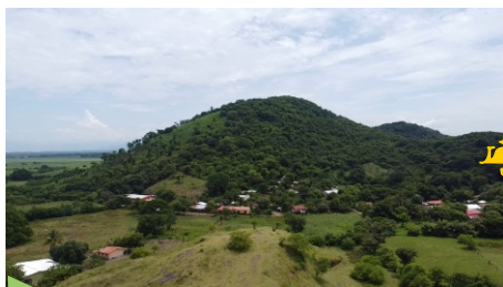
5 Cerro Titiscayan