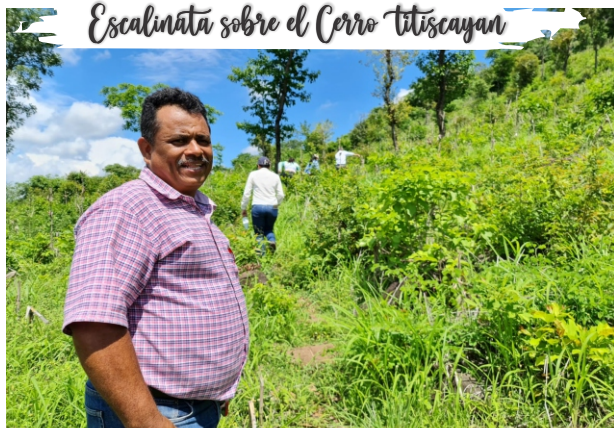
Escalinata sobre el Cerro Titiscayan