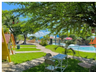
2 Rancho Los Carretos