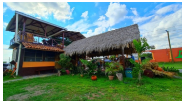
1 Guirilas del Sur